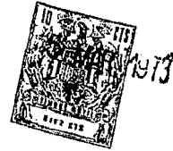
Cont. Tabla I