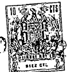
TABLA I (continuación)