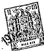
TABLA 2 (cont.)