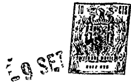
TABLA 3 (cont.)