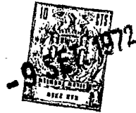
TABLA 5 (cont.)