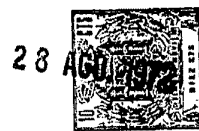
TABLA I (Continuación)