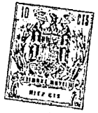
Fig. 2 401367