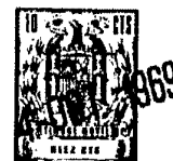
T A B L A I =====