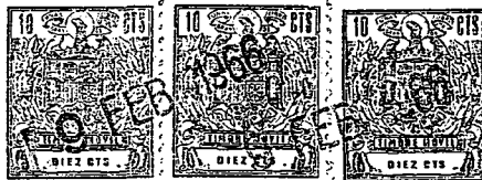
FIG. 2 a