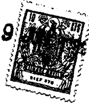
figura como "valor del lustre".