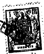
T A B L A I I