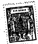
T A B L A V