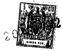
Fig. 3 280139