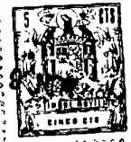
FIGURA-1 a - 271880