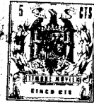
Fig. 1 26596