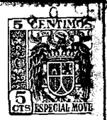
FIG. 1 194530