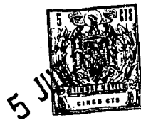
lámina de dibujos.