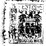
Fig. 1º 191111