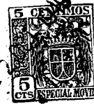
GRAFICO NUM 3.- (Fig.1ª,2ª y 3ª)