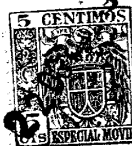
GRAFICO NUM 7.- (Fig. 1ª, 2ª y 3ª)