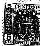
GRAFICO NUMERO 2

En Madrid, a ..... de 19... reunidos de una parte Don José Sánchez Martínez, mayor de edad, propietario de la patente económico-comercial número ..... y de otra Don ..... también mayor de edad, libre y espontáneamente ratifican y acuerdan el siguiente