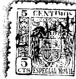
Gráfico nº 1