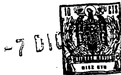
Figura 1, representa un soporte para sellos, según la invención, visto en planta. - - - - -

Figura 2, es una vista del mismo soporte, en alzado lateral.-