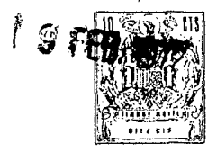
fig. 1. a