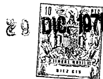
fig. 1. a