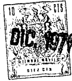
fig. 1. a