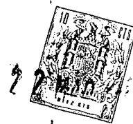
fig. 1. a