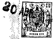
Fig. 1 a