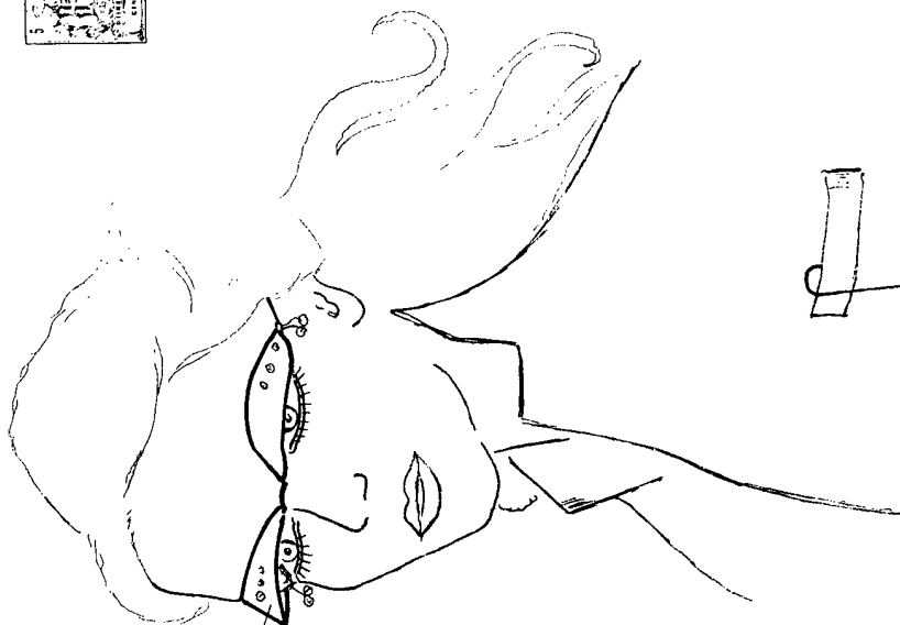
FIG. 3 a