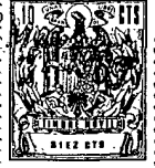
Fig 1 a