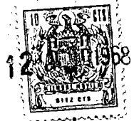
FIG 1 1409/3