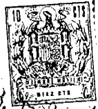
Fig. 1 136049