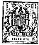
FIG 1ª 133194