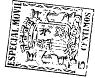
— Figura Primera —