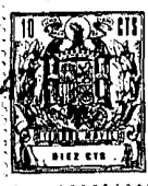
FIG - 2