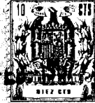
FIG. 1 128146