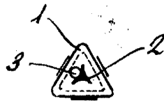
Fig. - 2