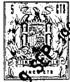
FIG.1 124695 FIG.2