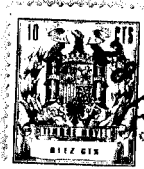
Fig 1 a