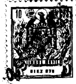
FIG. 1 18948