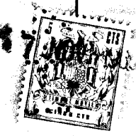
Fig. 1 117392