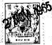
FIG. 1. a