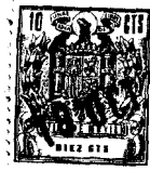
figura 1 a