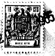
FIG. 1. a