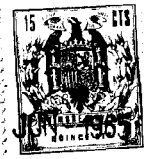
FIG. 1 114535 FIG. 2