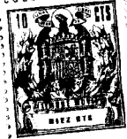
Fig. 1 113894