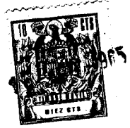
FIGURA 2ª, una vista posterior del mismo.

-15- De conformidad con lo representado el nuevo sillón está constituido esencialmente por una estructura sustentadora, formada por cuatro puntos de apoyo al suelo -5-, dispuestos dos a dos, de los cuales los posteriores son de mayor longitud que los anteriores, hallándose los de cada lado unidos entre sí por la disposición de sendos largueros transversales -6-, que constituyen al propio tiempo la base sustentadora del asiento.