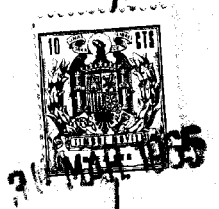
Fig 1 112434