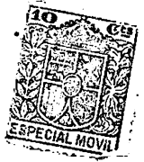
Fig. - 1.