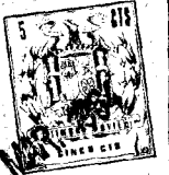
FIG. 1 104662