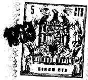
figura 1 a