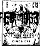
FIG. 199 FEB 1963