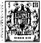
Fig. 1 97056