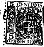
Fig. 1 95981 Fig. 2